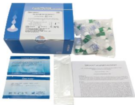
HEPATITIS A HAV IGM TEST CARD, SUERO, PLASMA Y SANGRE TOTAL.