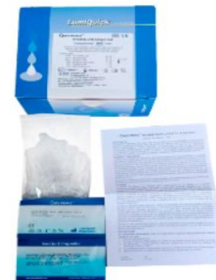
INFLUENZA A + B, NASOFARINGEO Y NASAL