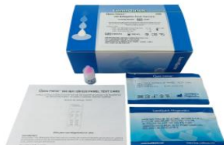
VIH + SIFILIS, SUERO, PLASMA O SANGRE