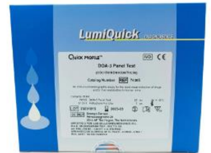
(COC/ MDMA/ THC)