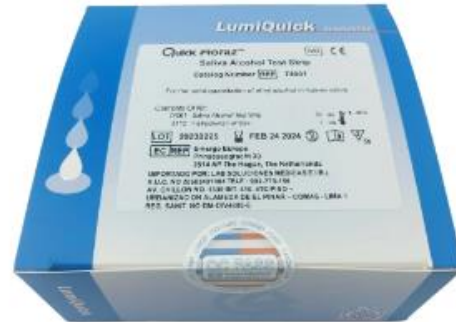
PRUEBA RÁPIDA ALCOHOL EN SALIVA