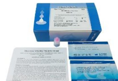
PRUEBA RÁPIDA HIV I & II TRILINE, SUERO, PLASMA O SANGRE