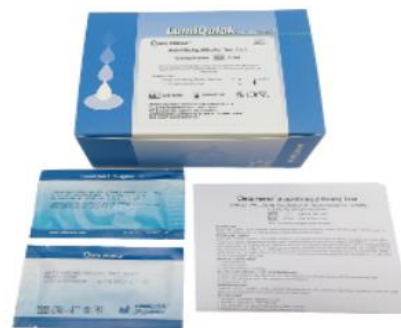
HEPATITIS B CORE (HBCAB), SUERO, PLASMA O SANGRE TOTAL