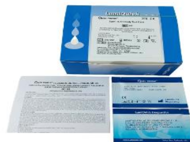
SIFILIS, SUERO, PLASMA O SANGRE