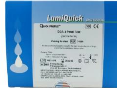
(COC / THC)