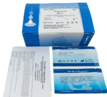
HEPATITIS B (HBSAG), SUERO, PLASMA O SANGRE