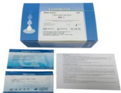
TUBERCULOSIS, SUERO PLASMA O SANGRE