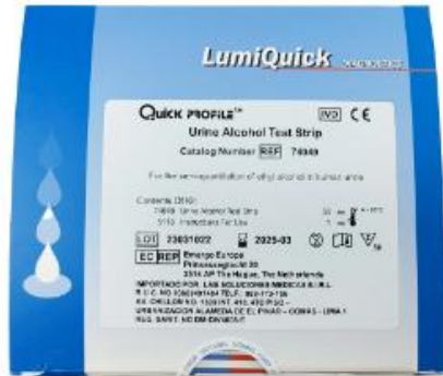
PRUEBA RÁPIDA DE ALCOHOL EN ORINA